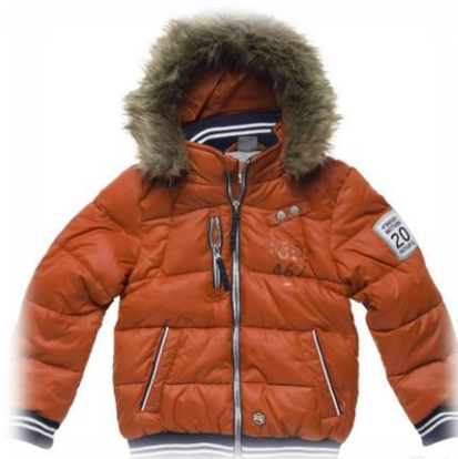
Kleding en kinderkleding gezocht