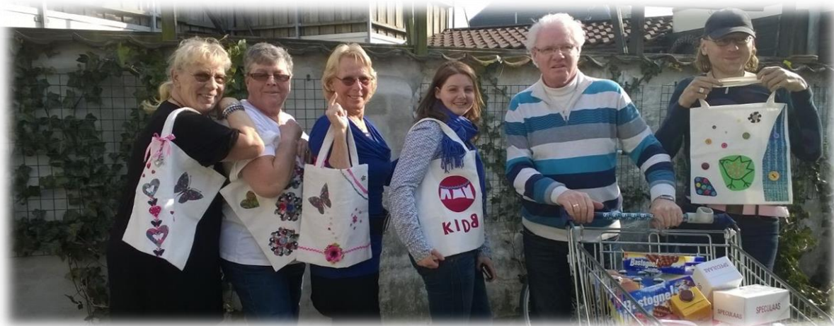
Prachtige tassen gemaakt tijdens de crea stof sensatie

Je kent het gezegde wel Achter de schermen kijken. Zien hoe alles in z'n werk gaat. Kijken hoe een organisatie van binnen werkt. Ook in 't Inloophuis gebeurt er van alles achter de schermen. Eigenlijk veel te veel om te kunnen laten zien. Maar toch is het wel leuk om een paar van die plaatjes te delen. Plaatjes van mensen die achter de schermen soms zoveel en zo bijzonder bezig zijn om alles maar te laten draaien.