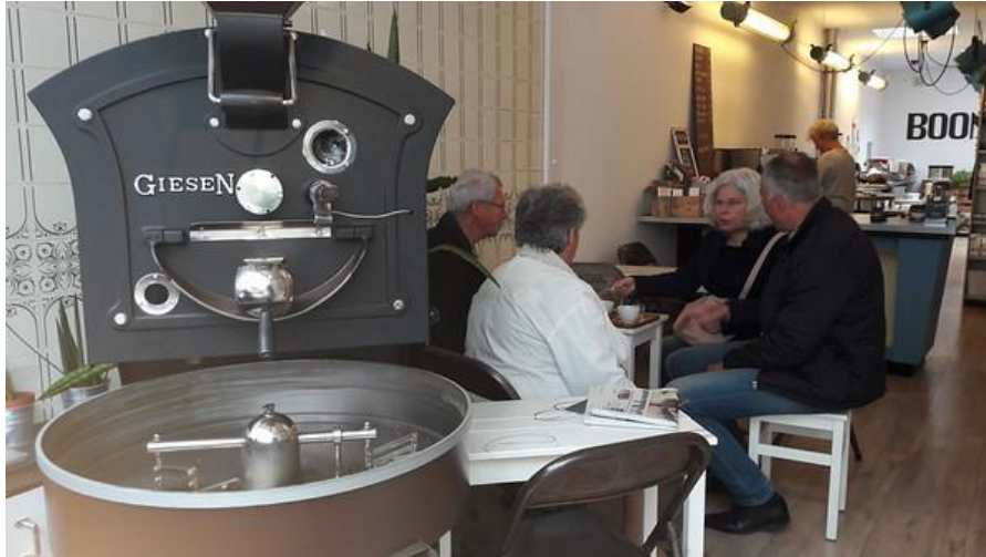
Bestuur 't Centrum & Meerpaal op werkbezoek bij een vergelijkbare Koffiebranderij in Den Haag

Het verhaal achter deze naam laat zich raden. Het gaat tenslotte allemaal over het begeleiden naar werk. Jongeren en ouderen die de aansluiting missen leren we een vak dat kan variëren van Barista, koffiebrander, boekhouder, verkoper, serveerster en nog veel meer. Juist voor die jongeren en mensen waar hun toekomst overhoop lijkt te liggen gaat dit project weer hoop geven.