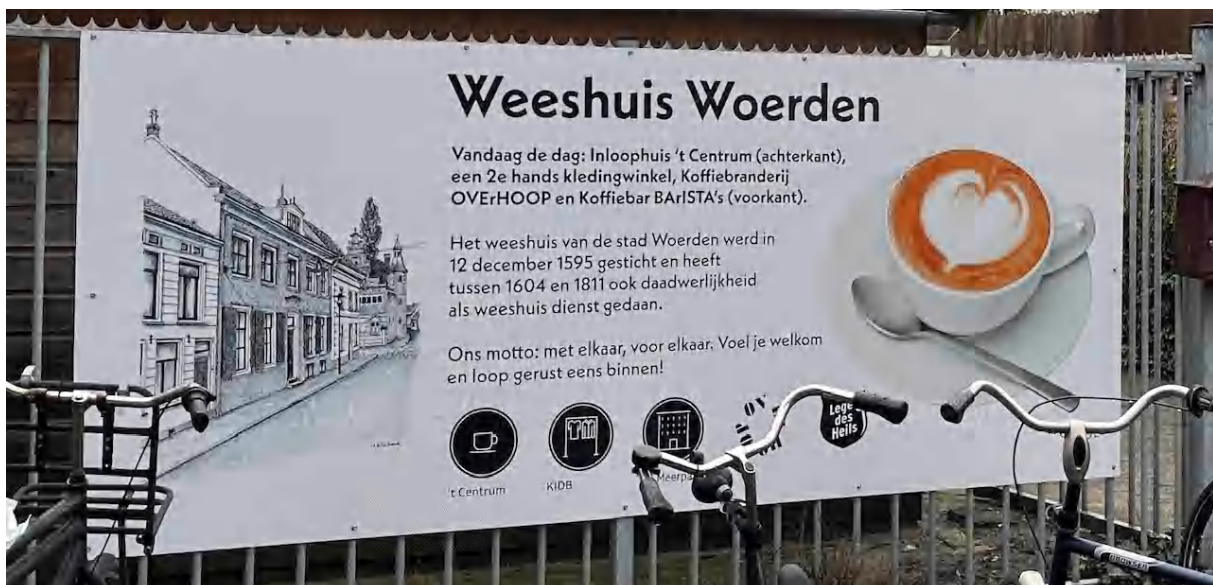
Het nieuwe entree bord bij de ingang van ons Inloophuis Hogewoerd 3A-1

Wat is het mooi om te zien dat iedereen in ons Inloophuis, in de 2 e hands kledingwinkel, in de koffiebranderij en koffiebar hun best doet om die vijf vingerwijzingen te volgen. Met elkaar, voor elkaar! En vaak gaat het verder. Als we onrecht zien of iemand missen. Dan spreekt God ons rechtstreeks aan of door anderen. Dan gaan we er samen voor. Eensgezind, met liefde voor onze naaste, met medeleven en bereid om de minste te zijn.